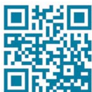
Skatteverket: Information om Personalliggare

I systemet TimeApp är alltid första användaren kostnadsfri och gratis och det är först från användare nummer två som det kostar. Det betyder att byggherren, som ska svara för att utrustning eller system för personalliggare finns på plats och sedan ha en dokumentation på att personalliggaren faktiskt används, inte behöver betala för varken utrustning eller system. Underentreprenörerna får för en låg kostnad tillgång till TimeApp, som är att betrakta som ett kompakt affärssystem och som sedan tidigare har ett avtal med EIO (Elektriska Installatörsorganisationen) och deras mer än 3 000 medlemsföretag. ■